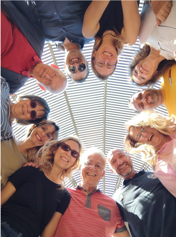
Los participantes durante su visita al Jardín Botánico de la Universidad de Málaga