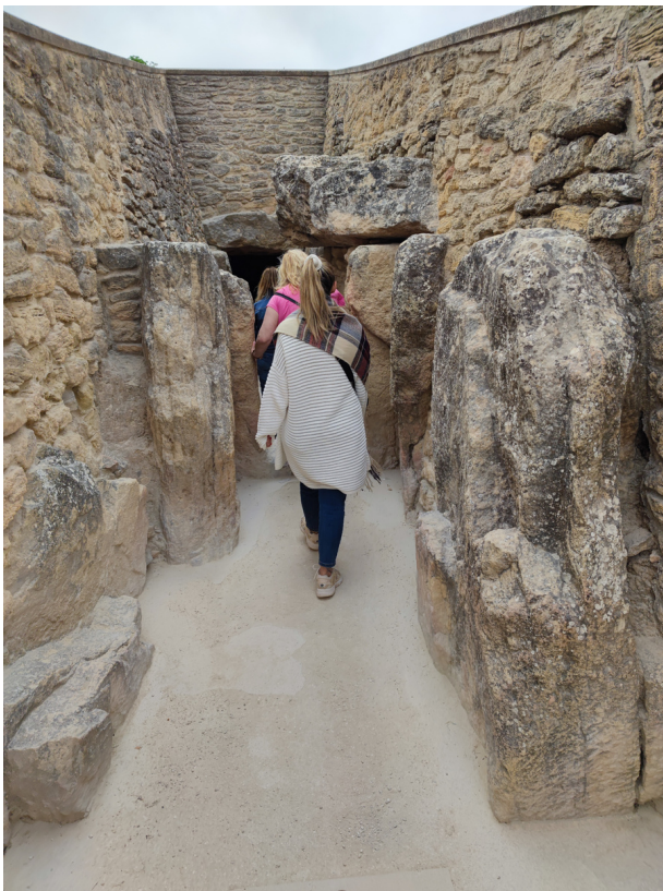
Visita de estudio a los Dólmenes de Antequera, el único elemento UNESCO en la provincia de Málaga province (Sensibilización patrimonial y conservación)