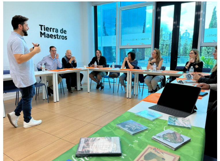
Sesión sobre Innovación Educativa en Tierra de Maestros