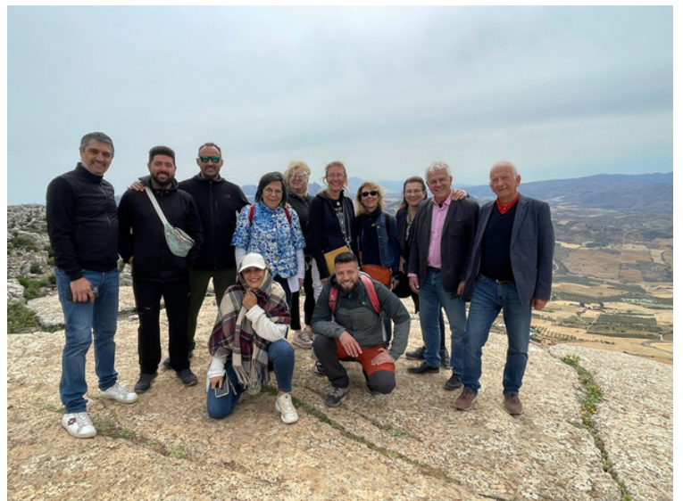
El grupo de participantes en el Torcal de Antequera