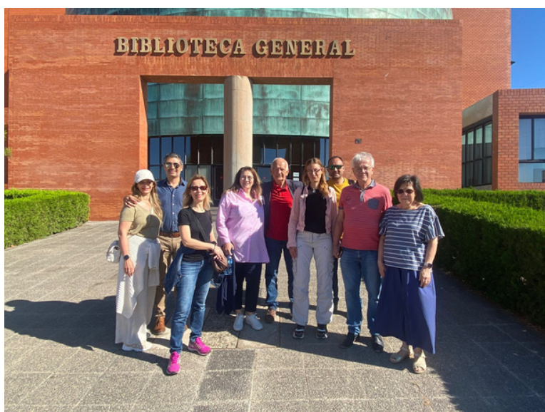
Visita a la Biblioteca General de la UMA (coordinado por el UMA International Hub)