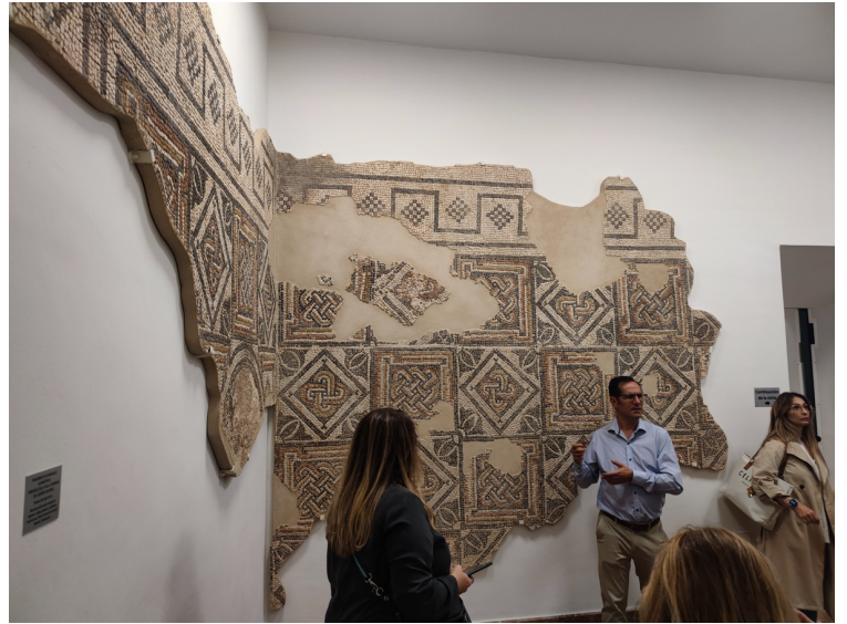
Visita de estudio al Museo Arqueológico de Antequera (Patrimonio cultural)