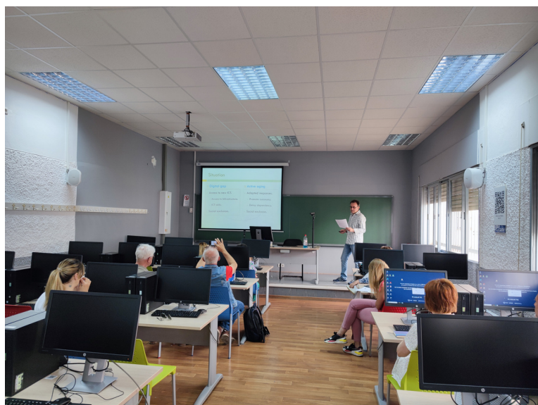
Taller sobre envejecimiento activo y TIC

En este seminario centrado en el intercambio de buenas prácticas, los principales temas abordados fueron "El patrimonio cultural como vehículo de desarrollo social" (TdM - Tierra de Maestros) y "Retos educativos para un envejecimiento activo" (UMA - Universidad de Málaga).